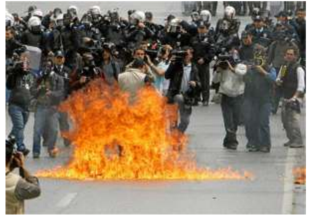
Trabajadores Turcos se enfrentan con la policía en la plaza Taksim