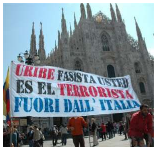
Trabajadores en Italia muestran su rechazo a la presencia de Uribe en ese país.