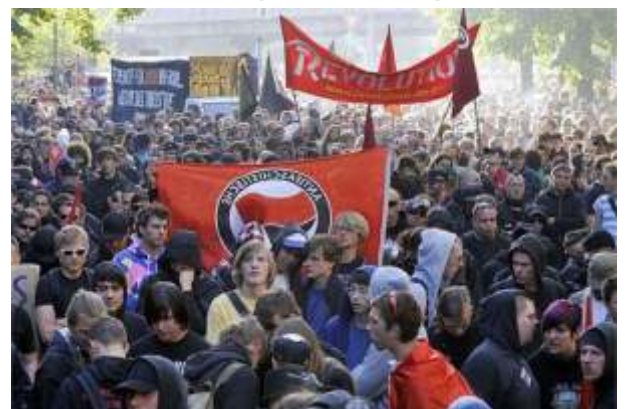
Manifestación en Berlín, Alemania