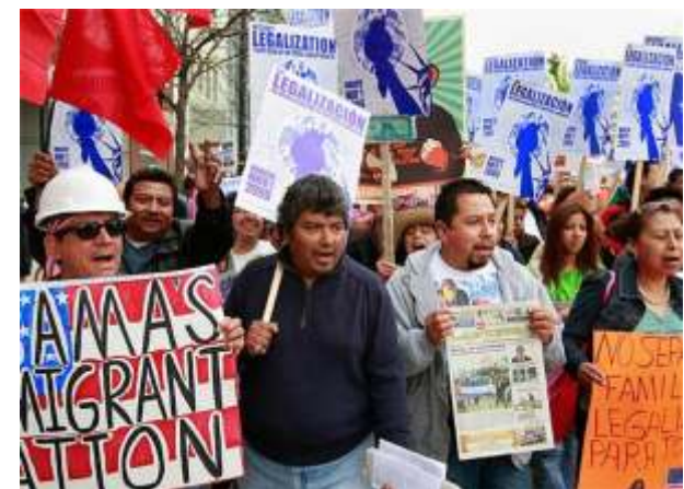
Inmigrantes en Estados Unidos