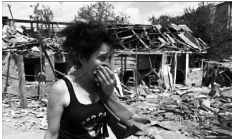
La región de Osetia del Sur en ruinas, luego de los bombardeos.

construcción del socialismo. Tiflis, la capital Georgiana había acogido con alborozo las mieles del poder obrero, precisamente en esta ciudad, cuna del glorioso José Stalin.