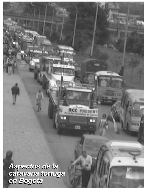
Aspectos de la caravana tortuga en Bogotá