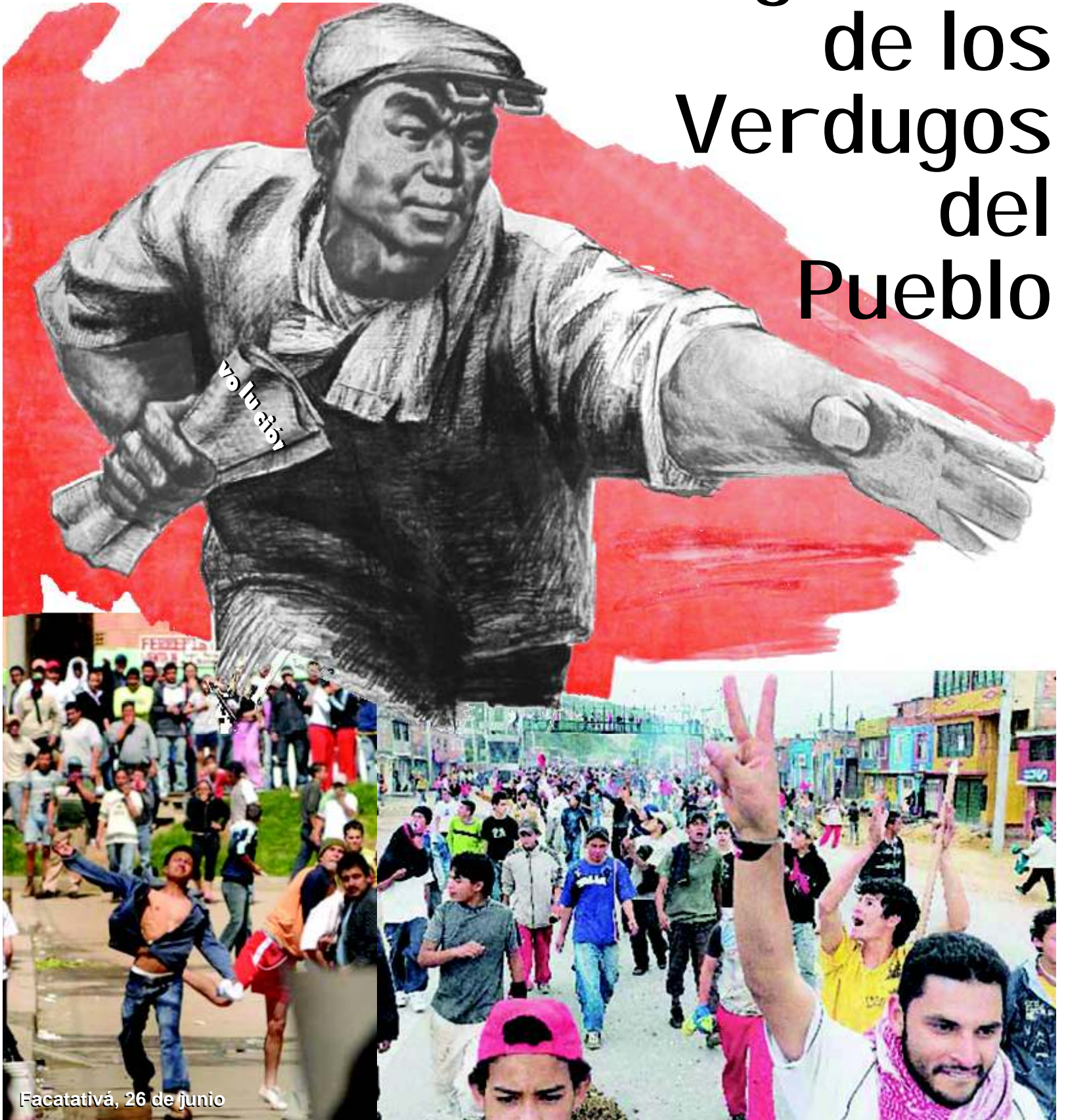
Facatativá, 26 de junio