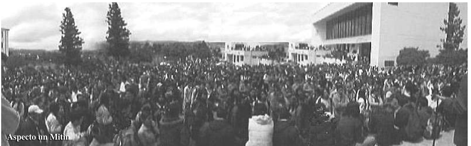
Aspecto un Mitin.

Trataron de Acabar, Boicotear y Derribar la Movilización pero no Pudieron, Sólo se dio por Terminada con Aires de Victoria y por parte de las Mismas Masas