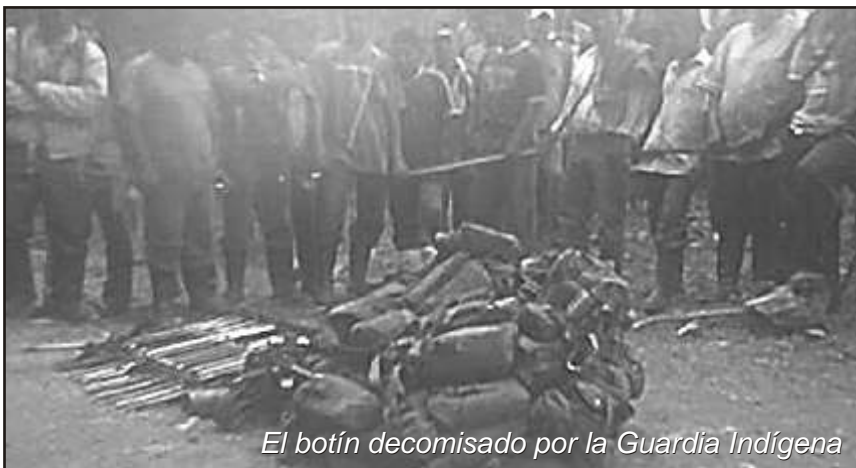
El botín decomisado por la Guardia Indígena

El pueblo ya está aprendiendo que la fuerza no reside en la sofisticación de las armas de un ejército moderno sino en sí mismo, en la fuerza revolucionaria del pueblo y éste se encargará de voltear las armas contra el patrón, es decir, desde las filas mismas de las fuerzas reaccionarias contra el Estado burgués, terrateniente y pro-imperialista que gobierna a Colombia.