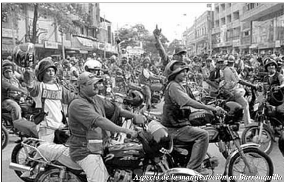
Aspecto de la manifestación en Barranquilla

Una vez más se ratifica que el camino es la movilización y la lucha directa de las masas; en cada una de estas luchas parciales el pueblo va acumulando experiencias que a la postre van formando nuevas generaciones de combatientes probados y experimentados, de hombres y mujeres que a diario se van preparando para las nuevas batallas, hoy por enfrentar al régimen de Uribe, pero muy pronto y en la medida que el movimiento obrero avance, en batallas por los cambios de fondo y para largo, en la lucha por la revolución socialista.