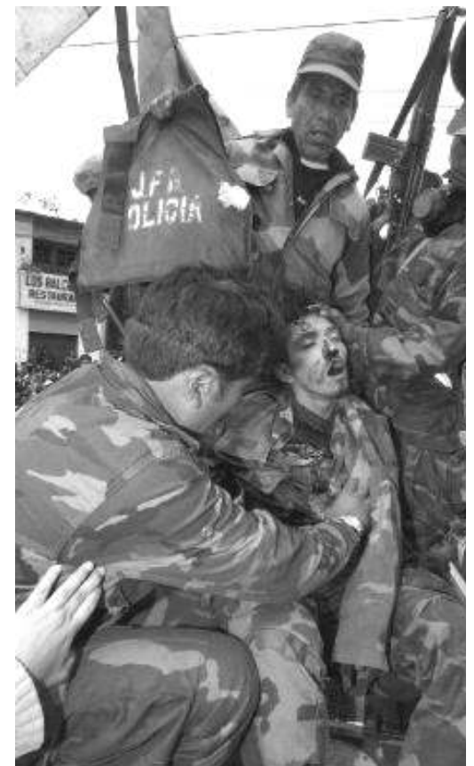
Jóvenes obreros y campesinos, carne de cañón en los ejércitos

[En nuestra próxima entrega: la posición pequeñoburguesa acerca del servicio militar obligatorio]