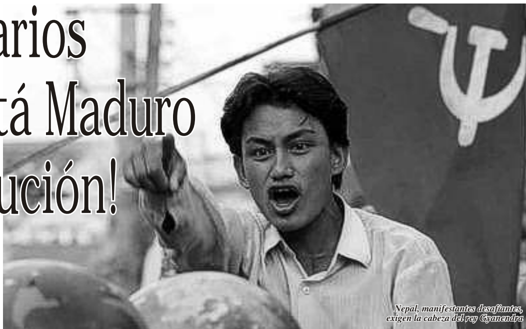
Nepal, manifestantes desafiando, exigen la cabeza del rey Gyanendra

El llamado “Nuevo Orden Mundial” del que tanto se ufanan los imperialistas como manera de embellecer la sociedad actual, es una gran mentira; lo que el mundo hoy vive no es un orden que beneficie a los pobres de la tierra; es en realidad una exacerbación del gran desorden que el capitalismo imperialista crea en todas partes para continuar con sus guerras de rapiña, en la disputa por el control económico, político y militar del mundo; disputa de la que son responsables principales los grandes países imperialistas, de los cuales la cabeza más visible hoy son los Estados Unidos, seguido de los países que conforman la Unión Europea, además de Japón, Rusia y China. Por donde se le mire, el mundo está convulsionado gracias a la agudización de las contradicciones que son propias de una sociedad donde impera el interés burgués, la economía burguesa, los principios y morales burgueses.