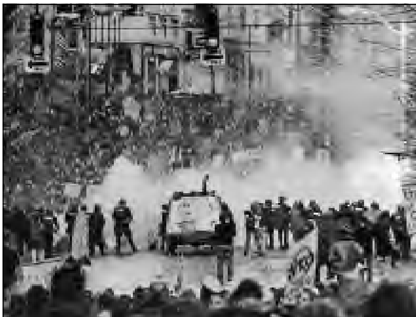
Manifestación en el centro de Seattle - EU, 30 de noviembre de 1999

Bob Avakian Presidente del Comité Central, PCR, EU