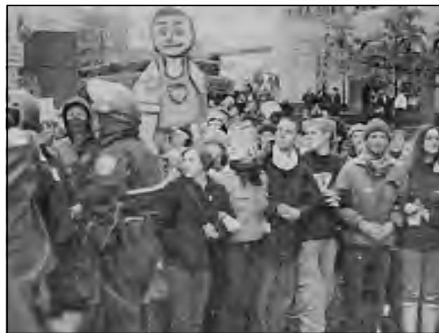
Bloqueo de calles cerca al Centro de Convenciones, 30 de Noviembre 1999.

En Nueva Delhi, cientos de personas del valle Narwada realizaron un plantón contra la OMC y contra la construcción de una represa en Maheshwar (un proyecto conjunto con Alemania) porque arruinará a quienes viven ahí.