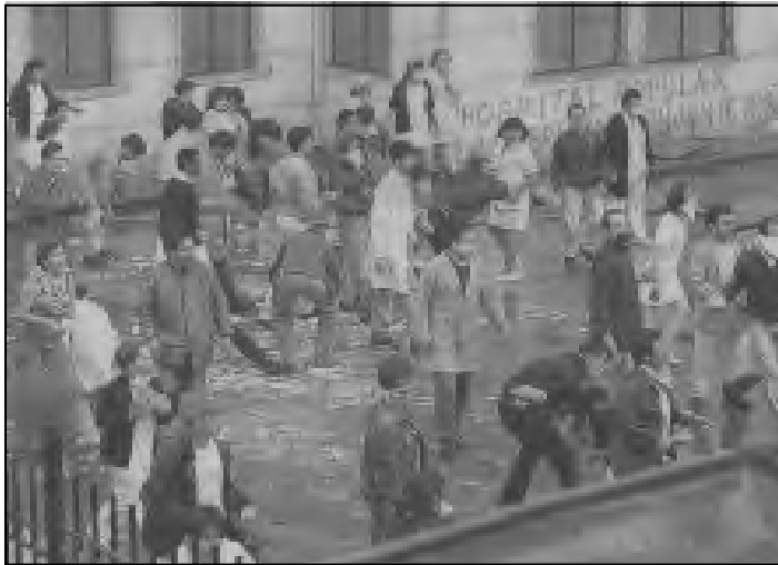
Así repelieron los trabajadores el ataque de la policía, el 17 de diciembre de 1999.