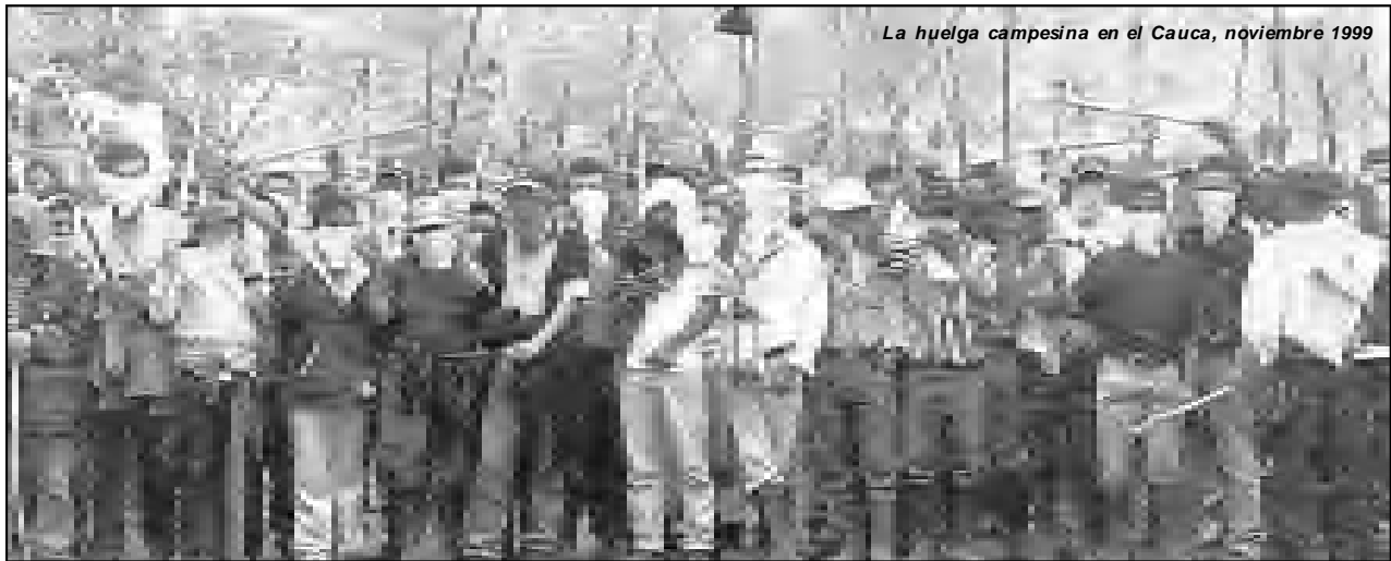
La huelga campesina en el Cauca, noviembre 1999