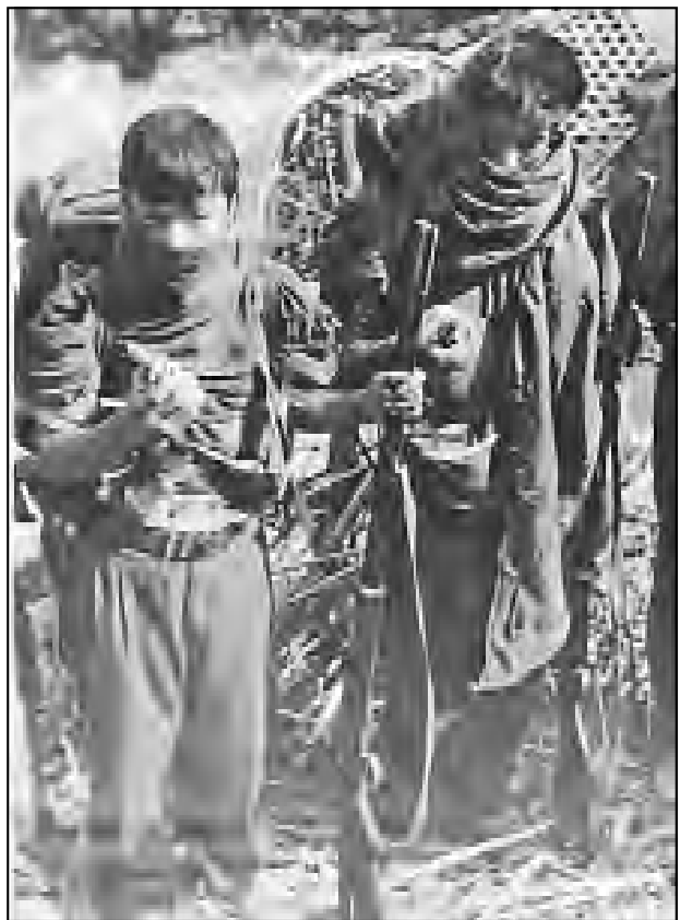
Combatientes de un escuadrón del Ejército Popular - Nepal

Para que todo eso sea realidad, los oprimidos y en particular la clase proletaria tienen que tomar conciencia de su misión histórica de hacer la revolución . Los que captan esto y están resueltos a luchar por ella, tienen que organizarse como poderosa fuerza-núcleo de la lucha para cambiar el mundo. Eso quiere decir que el proletariado necesita su propio partido de vanguardia . Tal partido fortalece constantemente sus raíces y organización en el proletariado y otros oprimidos, y recluta a quienes toman la delantera en la lucha revolucionaria. Tal partido se guía por la ideología comunista, por la concepción del mundo y método científicos que hoy se llama MLM (marxismo-leninismo-maoísmo, por los tres principales líderes de la causa comunista a