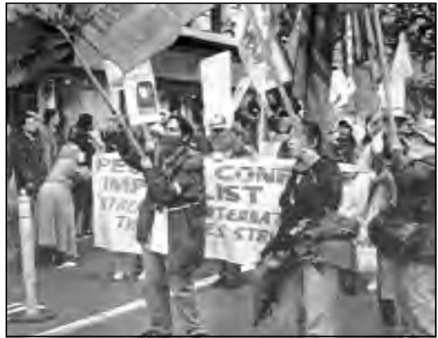
Marcha de la Asamblea Popular en Filipinas, 30 de Noviembre 1999.

También en Nueva Delhi, cientos de adivasis (un pueblo autóctono) del estado de Madya Pradesh bloquearon el edificio del Banco Mundial y lo cubrieron con afiches, pintas y postas de vaca. Criticaron las medidas del Banco Mundial y de la OMC para «liberalizar» el comercio de productos de madera porque han llevado al desalojo de los adivasis de sus tierras ancestrales. En una carta abierta proclamaron: «Luchamos contra los ingleses y lucharemos de todo corazón contra el tipo de colonialismo que ustedes representan.... Para el Banco Mundial y la OMC, nuestros bosques son una mercancía para vender. Pero para nosotros son nuestro hogar, la fuente de nuestra existencia, la cuna de nuestros dioses, los panteones de nuestros antepasados y la inspiración de nuestra cultura. No necesitamos que vengan a salvar nuestros bosques. No permitiremos que los vendan. Así que aléjense de nuestros bosques y de nuestro país».