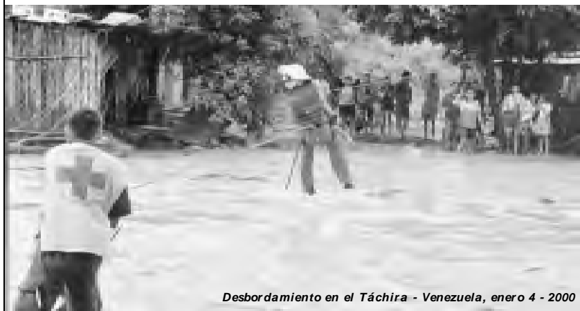
Desbordamiento en el Táchira - Venezuela, enero 4 - 2000

[Gracias a los datos enviados por un Lector de Medellín, se elaboró esta denuncia]