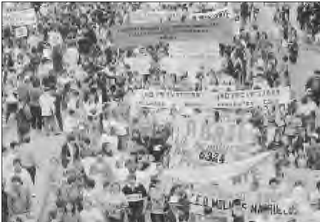
Una de las movilizaciones en Bogotá, durante el Paro de Octubre de 1998