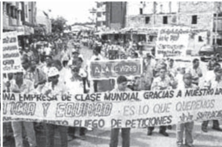
Manifestación de los obreros de El Cerrejón en Rioacha el 15 de enero.

Las manifestaciones y conflictos de principios de año, indican el ascenso sostenido de la lucha de masas y presagian nuevos y más poderosos enfrentamientos entre el pueblo y el régimen reaccionario. Los obreros conscientes y la intelectualidad revolucionaria deben redoblar sus esfuerzos por generalizar las formas de organización que le permitan a las masas luchar con independencia y avanzar en la preparación de una gran Huelga Política de Masas a nivel nacional por el conjunto de las reivindicaciones populares inmediatas, en la perspectiva de la revolución socialista.