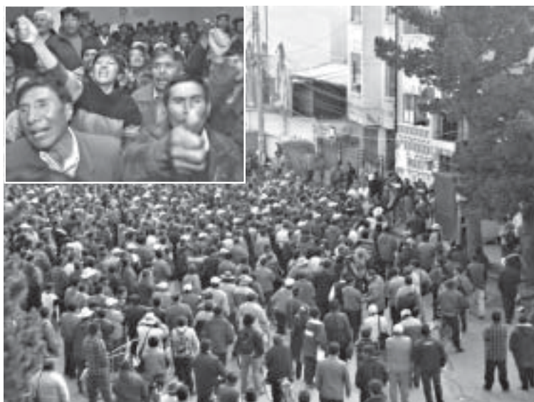
Manifestación obrero-popular en Bolivia durante la última Huelga General el 10 de enero. Página 6

La Declaración del ELN de Participar en Elecciones y la Táctica de la Clase Obrera. Página 2