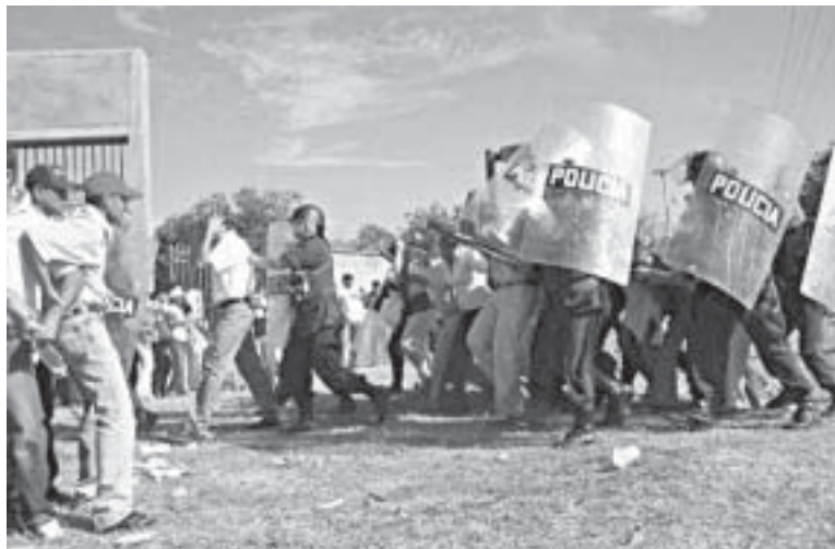
Enfrentamientos entre maestros y fuerzas del Esmad en Sincelejo el 16 de enero.