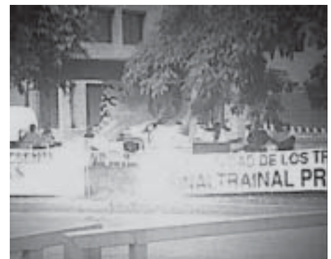
Asamblea del 9 de agosto en Cali

Los compañeros piden y necesitan la solidaridad política, moral y material de sus hermanos de clase y del pueblo en general.